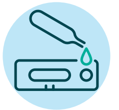
7. ኣብቲ ኣብነታዊ sample መመርመሪ ናይ ጠብታ ግበረሉ። እቲ ናይ ምርመራ መሳርሖ መምርሒ ከክንደይ ጠብታ ክትገብረሉ ከምዘለካ ክትሰረጸካ ኢዩ። እቲ ናይ ምርመራ መሳርሖ ኣይተንቀሳቕሶ ወይ ኣይተልዕሎ።