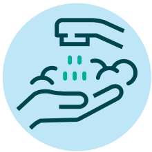
2. ኣእዳውካ ተሓፀብ