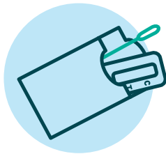
3. እቲ ዝመፀ ጥቕላል ክፈቶ