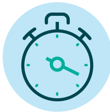
8. ቆይታ ሰዓት ኣጀምሮ። ኣብቲ ናይ ምርመራ መሳርሖ ዘሎ ናይ ሰዓት ኣጠቓቕማ መምርሒ ብትኸክል ተጠቐም። እቲ ኣብነታዊ (sample) ናይ ምርመራ መስኮት ኣይተንቀሳቕሶ ወይ ኣይተልዕሎ።