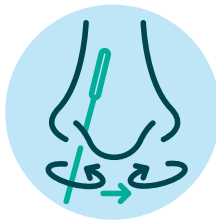
4. ከባቢ 2 ሰዓይ ናብ ኣፍንጫኻ ውሽጢ ኣቲኻ ነቲ ግድግዳ ኣፍንጫኻ ጎርጎርን ሕብስን ኣቢልካ ዝምርመር ሕባስ ኣውፅእ። ሓምሽተ ኻዕ ወይ ንገሰ ሰከንድ ኣብ ሕድሕድ ቀዳድ ኣፍንጫኻ ጎርጎር